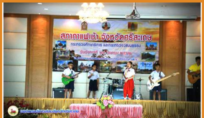
องค์การบริหารส่วนจังหวัดศรีสะเกษ