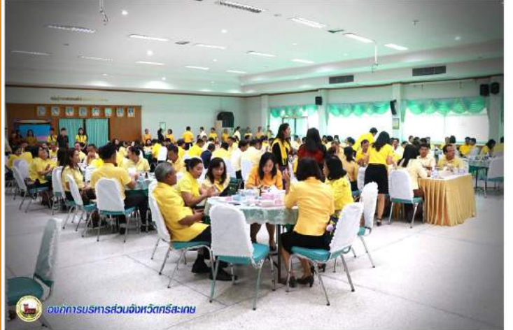
องค์การบริหารส่วนจังหวัดศรีสะเกษ