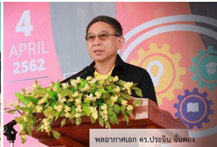
พลอากาศเอก ดร.ประจิน จั่นตอง