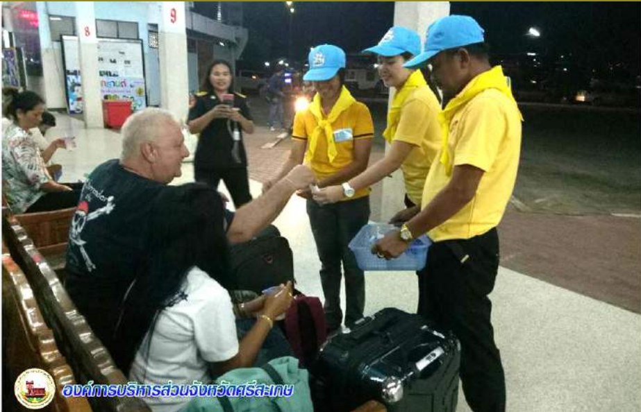
องค์การบริหารส่วนจังหวัดศรีสะเกษ

ข้าราชการและเจ้าหน้าที่สถานีขนส่งผู้โดยสารอำเภอกันทรลักษณ์ พร้อมจิตอาสาในเขตพื้นที่อำเภอกันทรลักษณ์ ปฏิบัติหน้าที่ร่วมส่งพี่น้องประชาชนเดินทางกลับเข้าทำงานหลังหยุดยาวช่วงสงกรานต์ รวมถึงให้บริการน้ำดื่ม ตลอดจนช่วยเหลือให้ผู้โดยสารเดินทางถึงที่หมายอย่างปลอดภัย